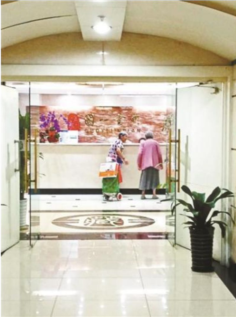
老人的购物车满载着种种“礼物”